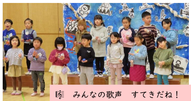
👁 みんなの歌声 すてきだね！