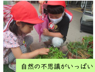
自然の不思議がいっぱい