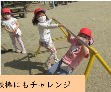
鉄棒にもチャレンジ