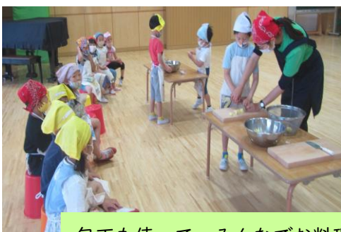
包丁も使って、みんなで料理