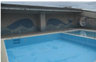
広～いプールでのびのびスイミング