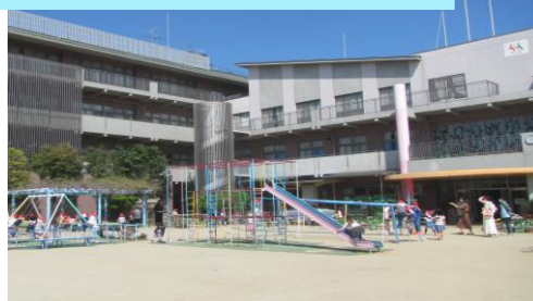
園庭でいっぱい遊んで体力 UP！