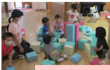
先生や友達と一緒に