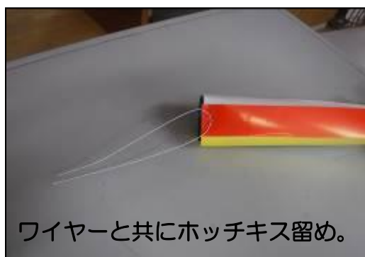
ワイヤーと共にホッチキス留め。