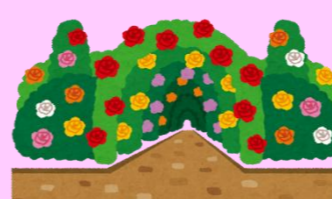
桂坂園芸まちづくり構想

コラボレーション企画 西総合フラワーロード 西総合屋上農園 桂坂市民ファームガーデン 薔薇いっぱい街づくり 小学校、中学校、児童館、 保育園、福祉施設のコラボ