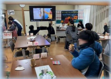
進化する西マルシェ