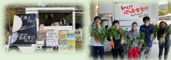
具だくさんみそ汁