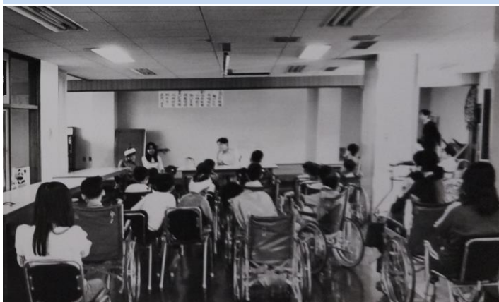
左：病室を借りて授業をしている場面