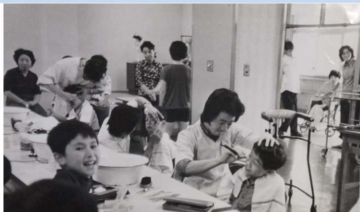
右：理髪奉仕の一コマ