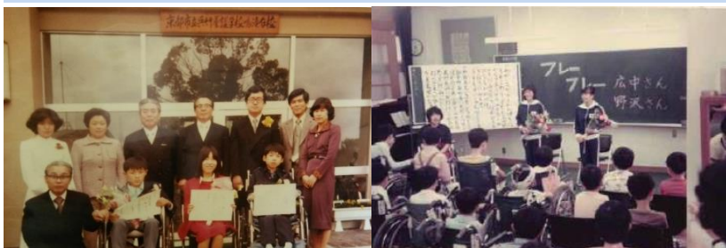
左：小学部 第1回卒業式