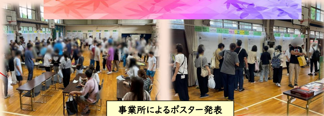
事業所によるポスター発表