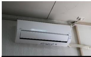
高等部男子更衣室