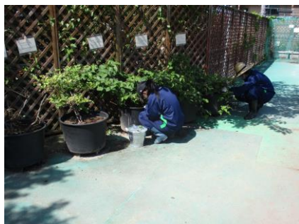
コミュニティサービス(1年生)