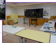
クラフト手工芸 フロア