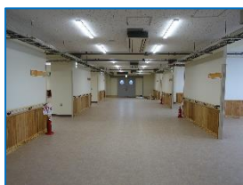
広い廊下が中央にあります