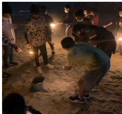
初日の夜は浜辺で花火を満喫