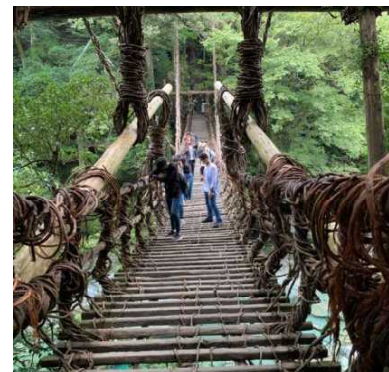
祖谷のかずら橋 揺れると怖かったです