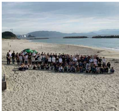
鳴門海峡をバックに全体写真 うっすらと大鳴門橋が見えます