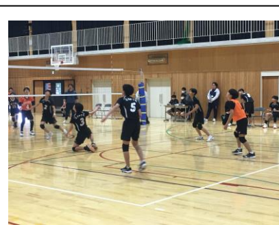
男子バレーボール部 洛水中 0-2 西京極中