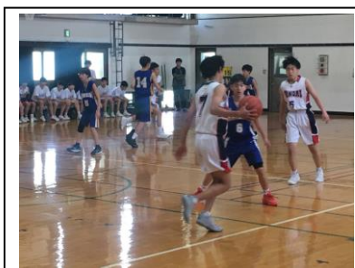
男子バスケットボール部 洛水中 45-74 京産大附