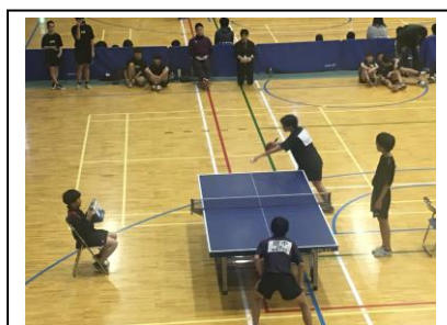
卓球部(男子) *個人敗退 団体 洛水中 3-0 藤森中 洛水中 0-3 加茂川中