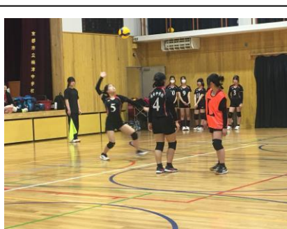
女子バレーボール部 洛水中 0-2 近衛中