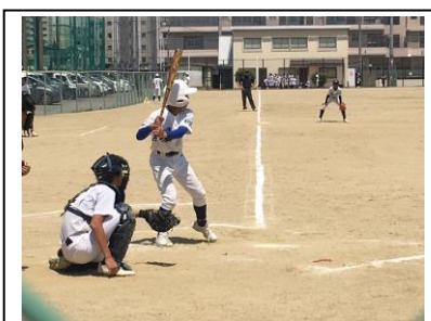
野球部 1回戦 洛水中 1-6 花山中 ※洛水は向島秀蓮小中・久世中と合同チーム