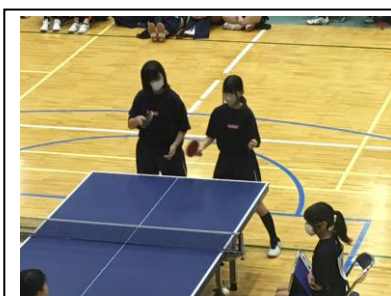
卓球部(女子) 団体 洛水中 0-3 勸修中 個人 予選敗退