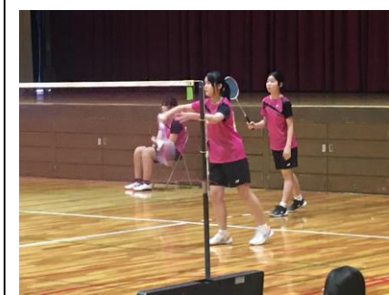
バドミントン部 団体 0-3 vs 西京附属・聖母中 個人 S2名 5/4 全市大会出場(横大路体育館)