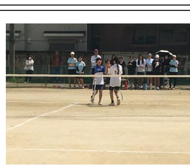
ソフトテニス部 団体 洛水中 0-3 松原中 個人 1ペア全市大会出場 5/3 西院コート