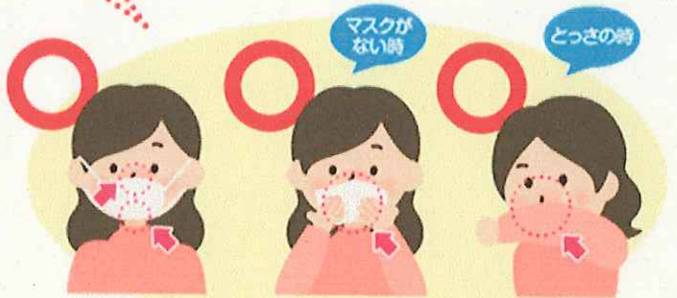
マスクを着用する (口・鼻を覆う) ティッシュ・ハンカチで口・鼻を覆う 袖で口・鼻を覆う