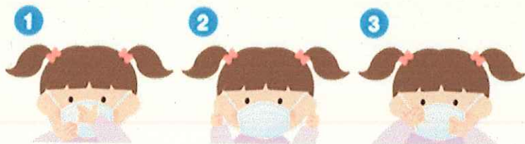
1 鼻と口の両方を確実に覆う 2 ゴムひもを耳にかける 3 隙間がないよう鼻まで覆う