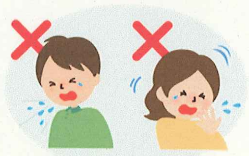
何もせずに咳やくしゃみをする 咳やくしゃみを手でおさえる