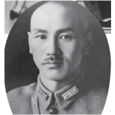
⑤ 蒋介石(1887~1975) 中国国民党 (国民政府)