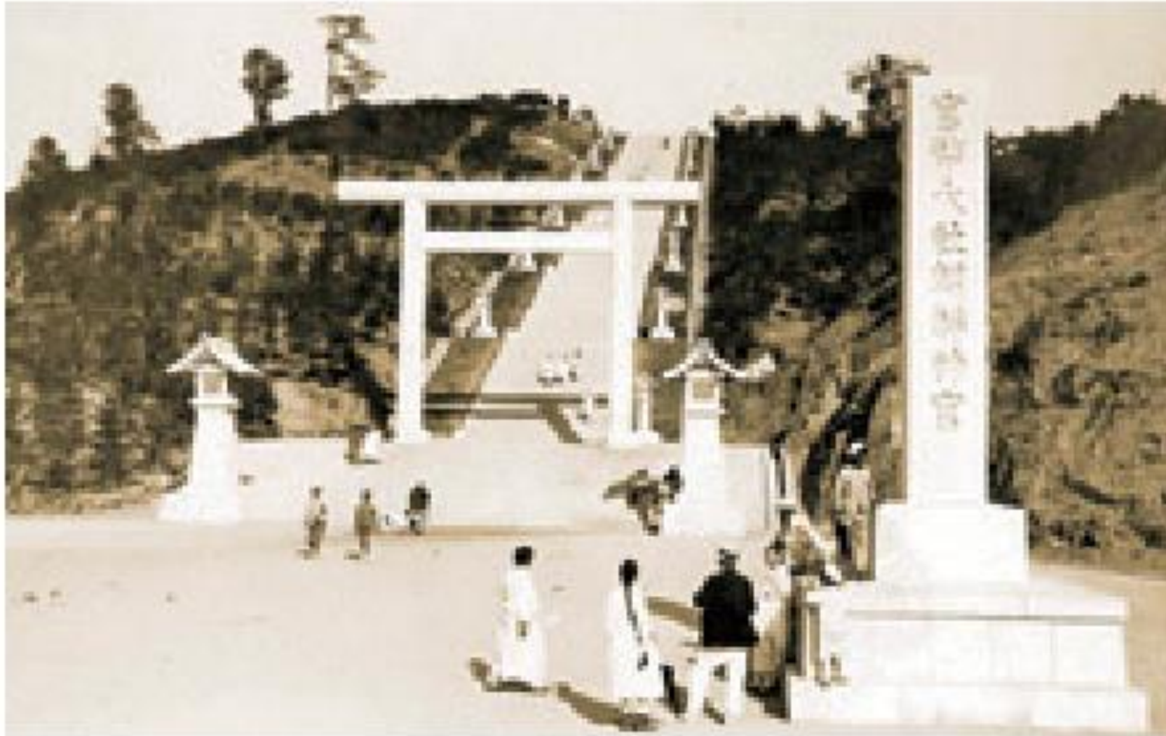
けいじょう ⑦ 京城(今のソウル)につくられた 朝鮮神宮