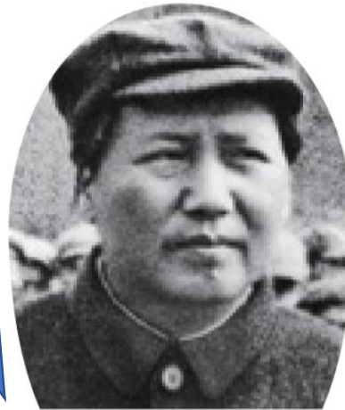
④ 毛沢東 (1893~1976)