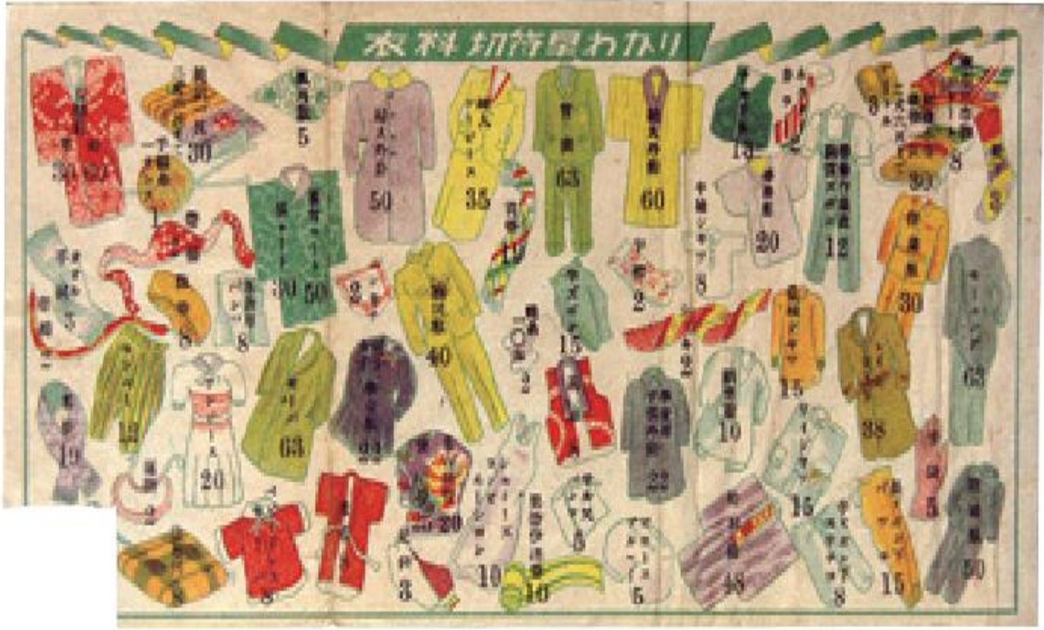
⑧衣料切符の早見表 とうきょう としま きょうど (東京都 豊島区立郷土資料館蔵)

国民の生活を統制し、生活物資（米、衣料品など）は配給制や切符制にしてすべての国民や資源を戦争のために使うために1938年 国家総動員法 が制定された