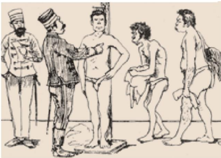
徴兵検査(ビゴー筆)

1873年に政府は 徴兵令 を出し、 20歳以上の男子 に 3年間 の兵役 の義務を課した