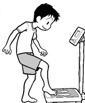
R3年度 身体測定 記録カード 洛西中学校