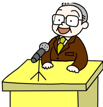
平成28年度末 退職・転出教職員

これまで本当にありがとうございました。大枝生諸君の成長を、今度とも見守っていただきたいと思います。