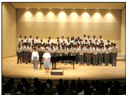
↓ 1年学年合唱「行き先」