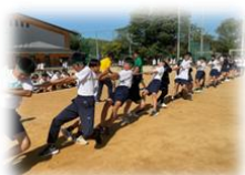
(昨年度の様子です)