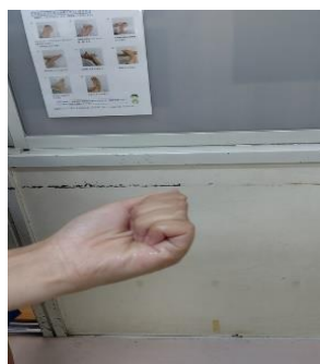
* 消毒液をにぎるように 指先を消毒