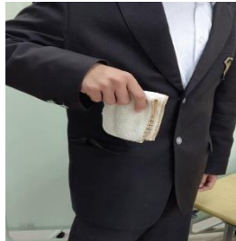
いつもポケットに入れておきましょう