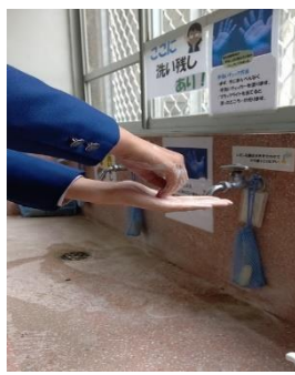
指先は洗えていますか