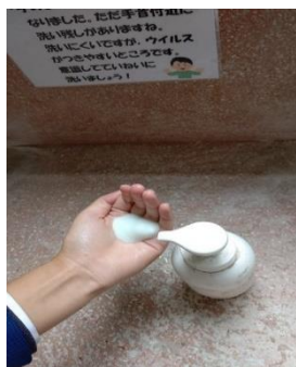
石けんはたっぷり取って