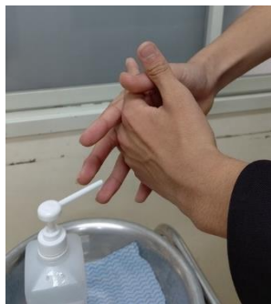
* 指の間にもつけて