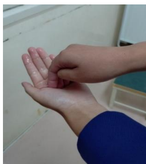
* 反対の指先もていねいに