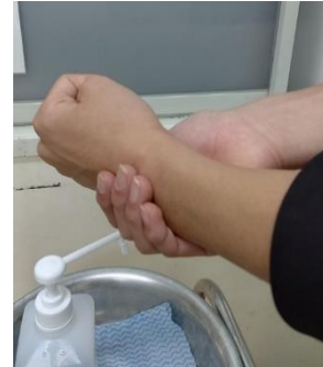
* 手首も忘れず消毒を