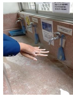
指の間もていねいに。