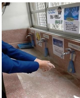
手全体にしっかりつけよう