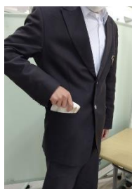
清潔なハンカチを