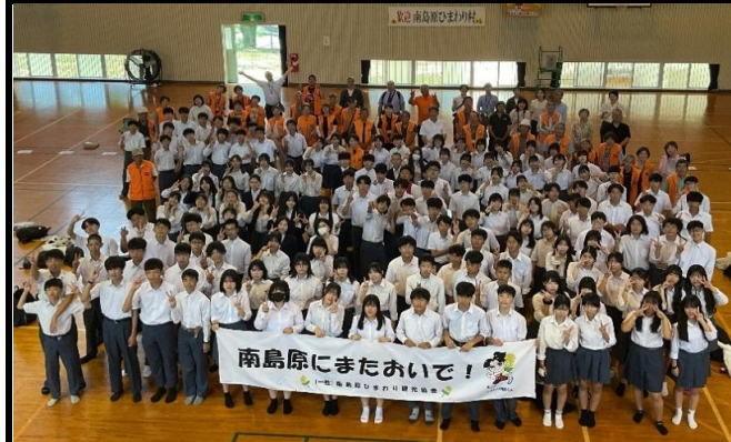
3年生修学旅行（5月28日～30日長崎方面）南島原ひまわり村民泊家庭のみなさんと記念撮影