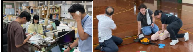
6月17日教職員研修（救命講習）の様子