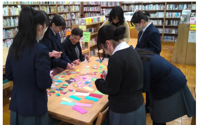
しおり作りをしている様子 →