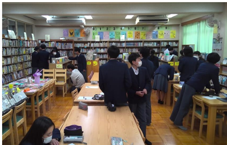
なぞ解きに取り組む1年生の様子👉