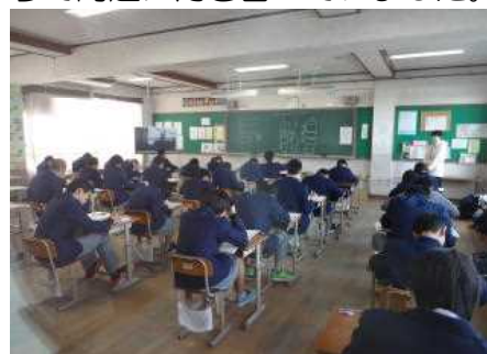
↑ 総括テストIV 2年生

1・2年生でも、1年の締めくくりの時期に入っています。まずは学習面で2月21日（水）～23日（金）に行われた総括テストに向けて『テスト前学習』に取り組みました。テスト1週間前の放課後、合計4回行われ、多くの生徒が熱心に教科担当の先生方に指導を受けていました。そして迎えた総括テスト当日、緊張した面持ちで問題に向き合っていました。