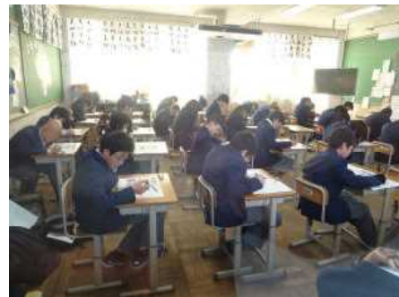
↑ 総括テストIV 1年生

また、学習面だけでなく生活の面でも次の学年での活躍につながるようなより良い形でこの1年を終えてもらいたいものです。ファインスパーク学習やチャレンジ体験で、学校では学べないことを学び、一回り大きく成長してくれました。