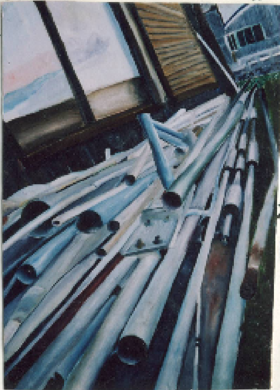
兵庫県 加西中(3年) 後藤美奈