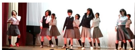
オープニング（生徒会本部）