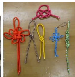
菊結び・男結び・叶結び ・あわじ結び・三つ編み