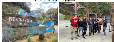
ネスタリゾート神戸