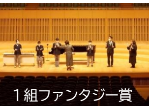
1組ファンタジー賞

生徒の皆さんも生徒会本部や文化委員会などを中心に、この状況の中、合唱コンクールはどこまでできるのか、どうすればいいのか、先生方と共に試行錯誤してくれました。さらに先生方から言われる感染予防対策については、きちんと従い守ってくれました。その上で創りあげられた令和2年度の合唱コンクール。これはある意味で、これまで以上の最高の合唱コンクールだと言えるのではないのでしょうか。