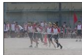
【縦割り対抗リレー】