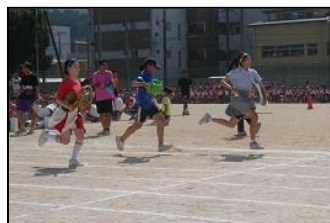
【3年生「パラティール」】