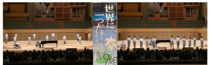
123年9組「世界に一つだけの花 他」

開催にあたり、コロナ感染状況は減少傾向ではありましたが、感染リスクを最小限におさえるための方策として学年別の開催と判断させていただきました。保護者の皆様方には、健康観察等にご協力いただき誠にありがとうございました。ご理解・ご協力をいただいたことに本当に感謝しております。