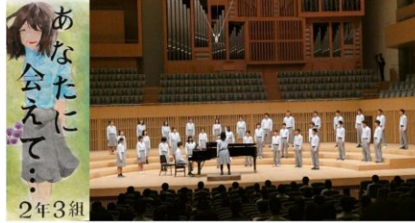
2年3組「あなたに会えて…」