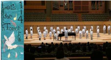
1年4組「Let's Search For Tomorrow」