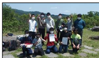
【女子ソフトテニス部】