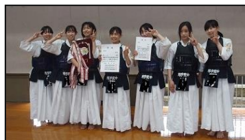
【ワグーフォーク部】