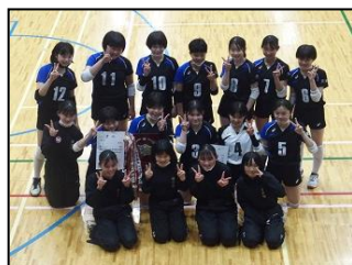
【男子バスケットボール部】