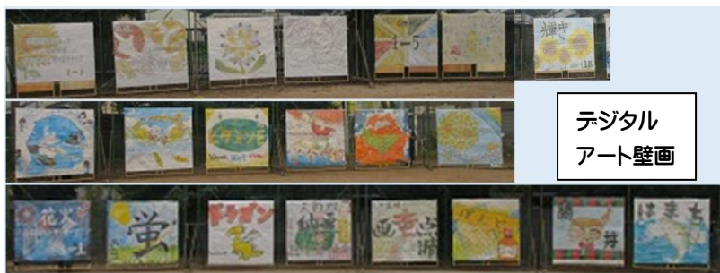
デジタル アート壁画

また、昨年度同様、例年、体育大会時に掲げていた学級旗に代わって、クラスみんなで一つのものを作品として仕上げた各学級のシンボルをデジタルアート壁画として、生徒席の周囲に展示しました。各学級、素晴らしい芸術作品でした。