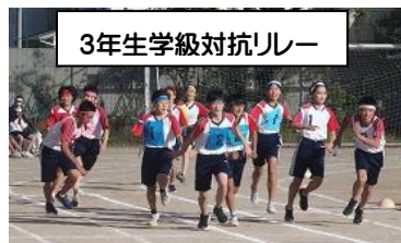
3年生学級対抗リレー