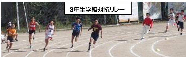
3年生学級対抗リレー