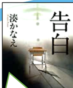
第6回大賞(2009年) 「告白」(湊かなえ)