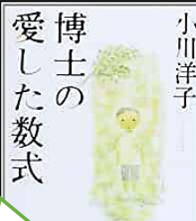
第1回大賞(2004年) 「博士の愛した数式」 (小川洋子)

書店員さん達の投票によって決まる「本屋大賞」作品。受賞作は、ドラマ・映画化されることも多く、広く愛されています。