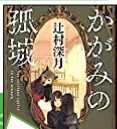
第15回大賞(2018年) 「かがみの孤城」 (辻村深月)