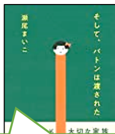
第16回大賞(2019年) 「そして、パトンは渡された」 (瀬尾まいこ)