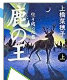
第12回大賞(2015年) 「鹿の王」(上橋菜穂子)