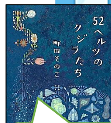
第18回大賞(2021年) 「52ヘルツのクジラたち」 (町田そのこ)