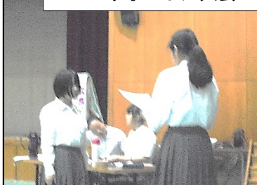
ビブリオバトル大会

① いろいろなことを通して、いろいろなことを知ることができました。本に対しての楽しさなどがとても感じることができました。本当に良かったです。