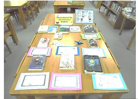
Teachers' & Students' 本紹介

② 本を読んでみてください。ためになることは、なきにしもあらず。(少しでもあります!)