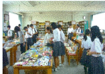
昨年の選書会のようす