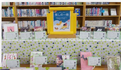
図書館内のコーナー

教養委員さんが作成した POP を廊下と図書館に掲示しています。展示したとたん、あっという間に借り手がつき、おすすめ本のコーナーには数冊が残るのみとなりました。