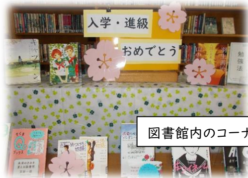
図書館内のコーナー