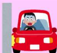
歩道・車道の区別のない道路