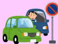
路上駐車が多い場所