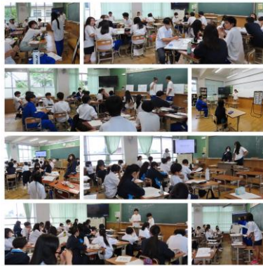
～生徒総会 学級討議～