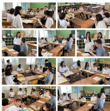
～イングリッシュカフェ～