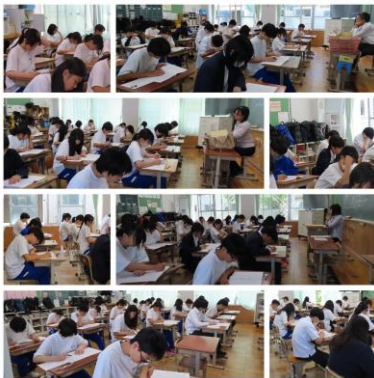
～3年生 学習確認プログラム～