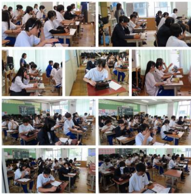
～全国学力学習状況調査（英語）～

5月は、2年生がチャレンジ体験、3年生は定期テストや学習確認プログラムなど、さまざまな活動に意欲的に取り組みました。それぞれの活動を通じて、働くことの意義や社会との関わりについて理解を深めたり、自分の学習状況を見つめ直したり、進路に向けた意識を高めることができました。また、授業では英語力の向上を目指した取組を進め、生徒が積極的にコミュニケーションを図る姿が見られています。地域では松尾祭（還幸祭）が行われ、地域の伝統や人とのつながりの大切さを感じる機会となり、充実した一か月となりました。