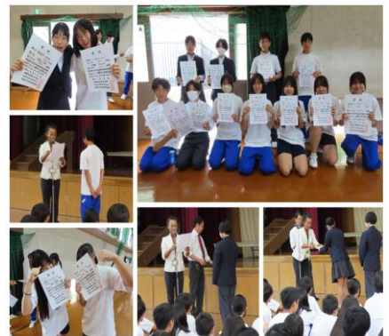
～春季大会 伝達表彰～