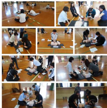
～職員研修（救急救命）～