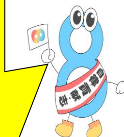
八条中学校 マスコット キャラクター 「はっちー」