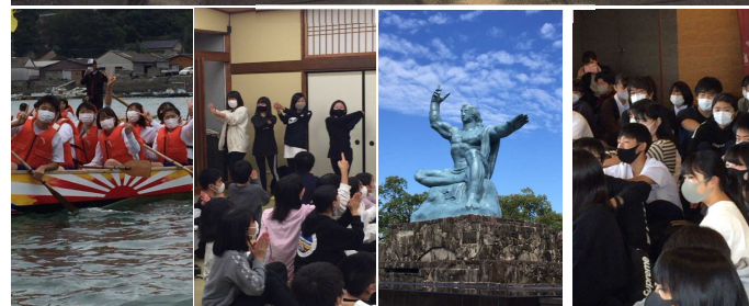
【ペーロン】 【レクリエーション】 【平和セレモニー】 【「Hey和」の歌声】