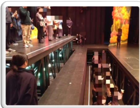
南座舞台裏体験ツアー