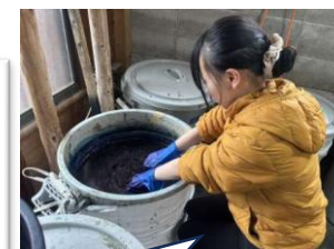
11/25～ ガクゲイのトビラ (藍染)