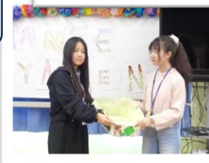
11/21・金 正しい歩き方教室