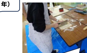
12/10・水 そば職人に学ぶ (1、2年)