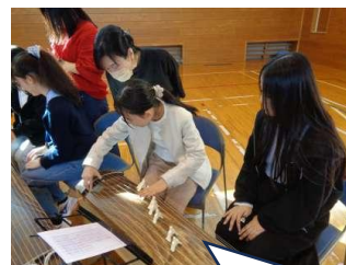
10/29・水 ようこそアーティスト