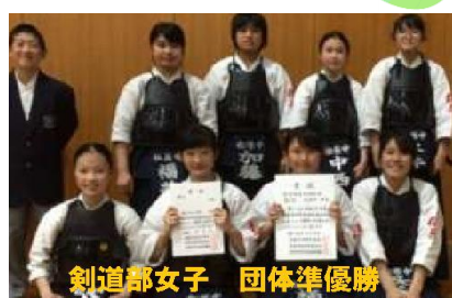
剣道部女子 団体準優勝