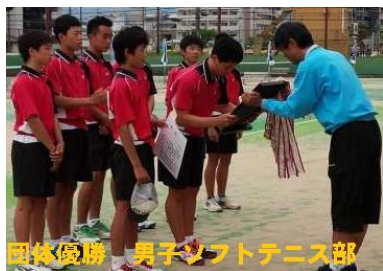
団体優勝 男子ソフトテニス部