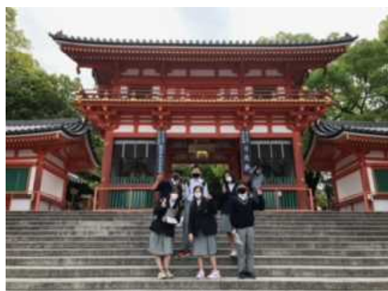
【2年班別行動：八坂神社】

コロナ感染が落ち着いたため、2年ぶりに校外学習が実施できました。1年生は嵐山方面で班別行動とレクリエーションを、2年生は京都市内で班別行動を行いました。