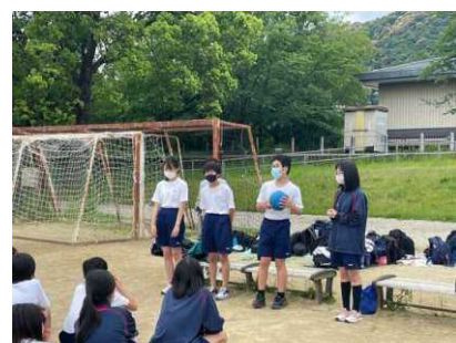
【1年レクリエーション】

人と上手に関わることができることは今後の社会に絶対必要な力です。本校でもその力を伸ばそうと教育目標に掲げ、日々取り組んでいます。今回の校外学習は、仲間と関わり、協働できることを目的とした取組です。もっと感染が収まり、授業などでもグループワークが出来るようになると、さらに生徒の生きていく力になると思います。今しばらくは感染状況を見つつ、工夫して教育活動を進めていきたいと思っています。