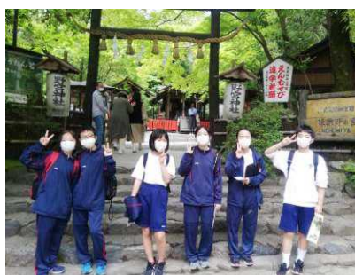
【1年班別行動：野々宮神社】