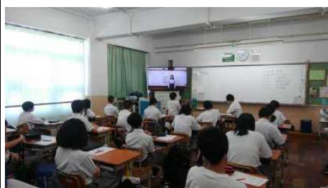
↑ ポスターセッション

また、それぞれの学年のポスターセッション、3年生の学年劇や演劇部の発表はどうだったでしょうか。zoomでの配信やビデオ配信を見るという形は、コロナ禍での新しい試みです。これから、こういうやり方が発展していくのかなと思うと不思議な感じがします。今後が楽しみです。