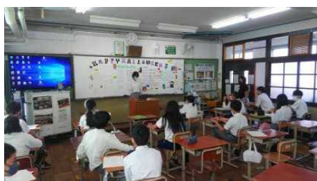
↑ ポスターセッション