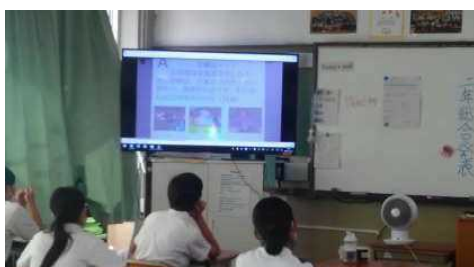
↑ ポスターセッション