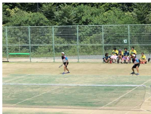
夏季大会 女子ソフトテニス部 団体第3位