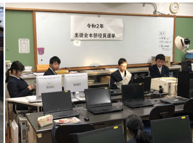
↑リモート立ち会い演説会