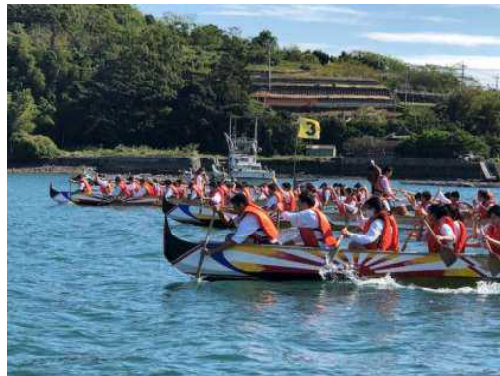
↑パイロン体験 クラス対抗で競争しました