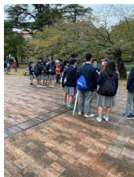
←「さるくガイドさん」 による平和学習