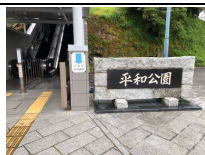
平和公園に飾った 千羽鶴→