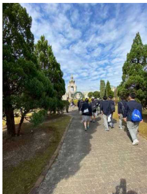
↑有田ポーセリングパーク 有田焼制作をしました

延期、延期となっていた3年生の修学旅行は、この10月16日～18日に長崎に行って、無事帰ってきました。有田ポーセリングパークで有田焼体験や長崎平和公園での平和学習、パイロン体験、長崎市内班別行動など盛りだくさんの企画に生徒たちは生き生きとした表情で楽しむことができました。コロナ禍の修学旅行ということで、ソーシャルデスタンスや3密に気をつけたり、手の消毒等にも気を遣ったりと不自由な面もありましたが、とても充実した修学旅行でした。楽しんでいる生徒を見ている私がとても楽しかったです。本当に行くことができたといい修学旅行でした。