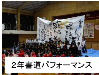
2年書道パフォーマンス