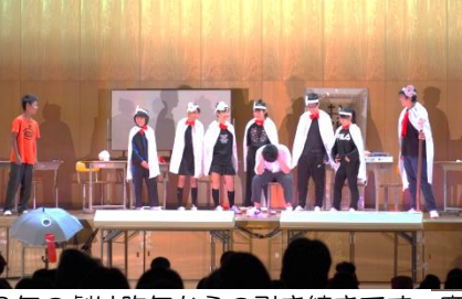
2年の劇は昨年からの引き継ぎです。磨きがかかってきました。3年の劇は迫力のお芝居でした。W