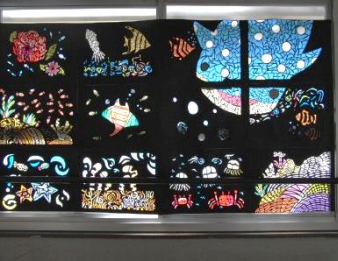
2年の学年展示はステンドグラスです。3年の高校訪問学習のポスターです。