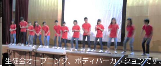
生徒会オープニング、ボディパーカッションです。