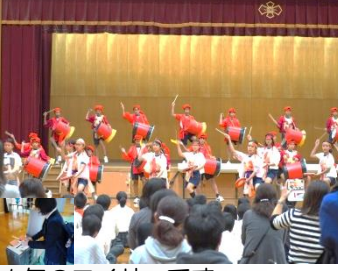
1年のエイサーです。

午前中は、中京中学校体育館で、生徒会のオープニング、そして1年のエイサー、2年、3年の演劇、それぞれの学年の発表がありました。そして教科や部活動の展示鑑賞を行いました。