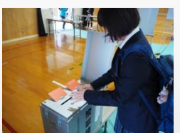
選挙運動から立会演説会、そして投票です。