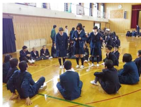
レクを楽しむ様子